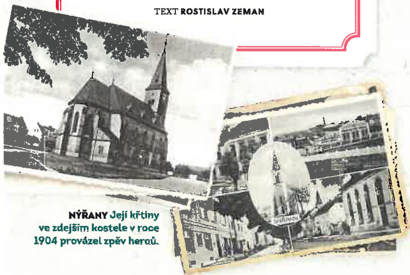
NÝŘANY Její křtíny ve zdejší kostele v roce 1904 provázal zpěv herců.